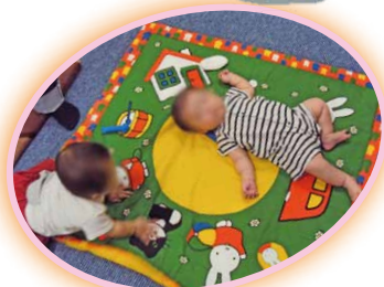
パパも体験！ほほえましいね！