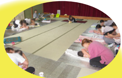
ベビー マッサージ