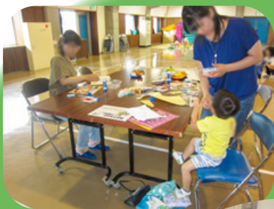
スクラップ フッキング