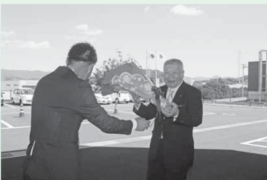
初登庁の日、多くの町民、職員が町長の初登庁を出迎え、花束が送られました。