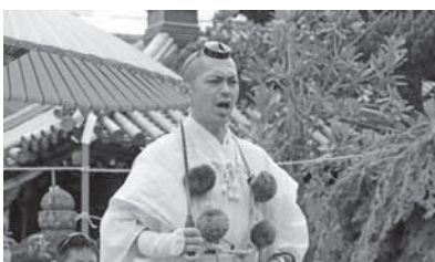
▲山伏の真偽を確かめる山伏問答