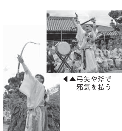
◀▲弓矢や斧で邪気を払う

聖護院門跡では、鎌倉時代末期から大峰奥駈修行を行い、その帰路で深専寺に立ち寄りもてなしを受けたことがきっかけとなって、今日まで親交が続いてきました。講演の後、奥駈修行の帰路にあたる熊野古道を山伏行列が深専寺を目指して歩き、深専寺境内において護摩法要が行われ、多くの方が見学されました。