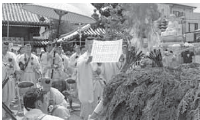
▲祈禱文を読み上げ修行終了の感謝や無病息災、家内安全を念じる