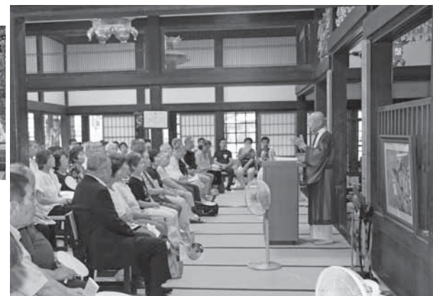
▲宮城門主の講演に聞き入る大勢のお客様