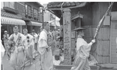
▲山伏行列が深専寺を目指す