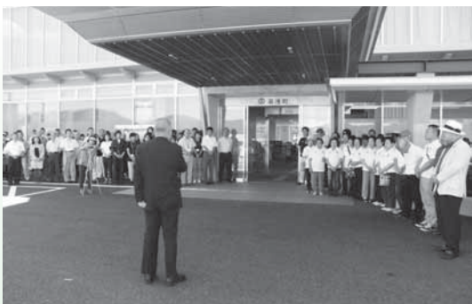
8月31日初登庁で挨拶する上山町長

まだまだ残された課題や問題が山積していますが、一つひとつ解決し、魅力溢れる湯浅町を創造してまいります。 (平成28年9月第3回 定例会町長所信表明抜粋)