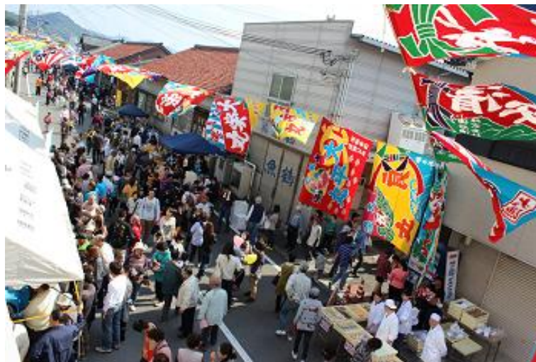
人々で賑わう祭りの様子