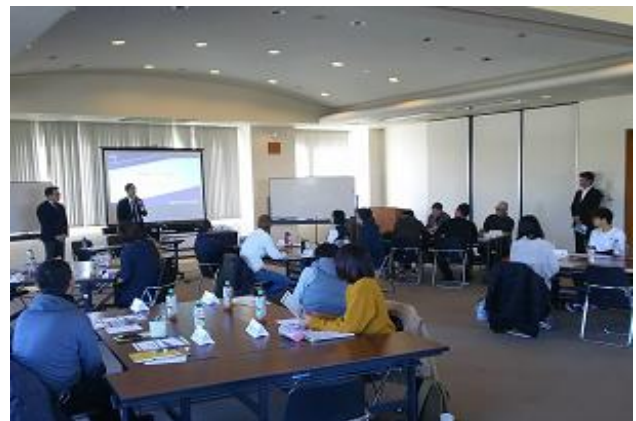
創業支援セミナー