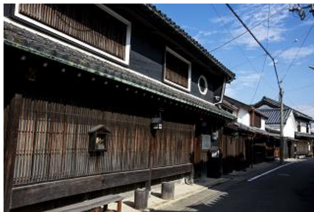
湯浅伝統的建造物群保存地区