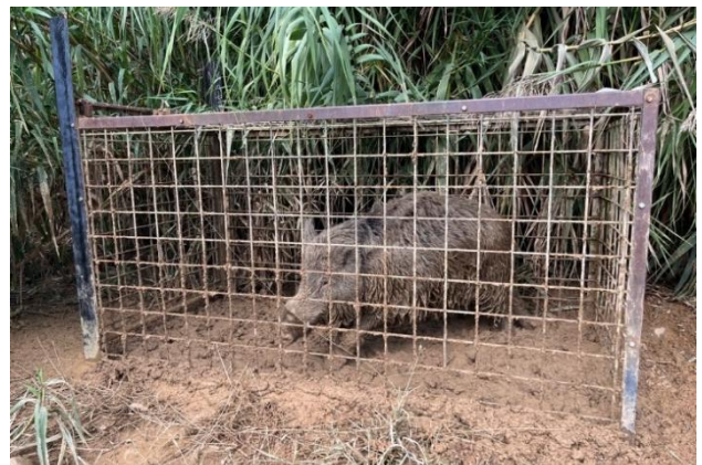
鳥獣を捕獲する檻