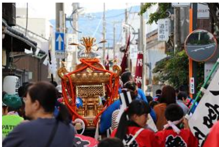
商店街を練り歩く神輿

○本町の事業所においては、近年厳しい経営環境が続いており、経営者自身の高齢化や後継者不足等の理由により廃業する事業所も発生しています。このような中、人口減少に伴う働き手の不足や高齢化・老朽化する経営環境において、町内の事業者の経営力の強化を後押ししていく必要があります。