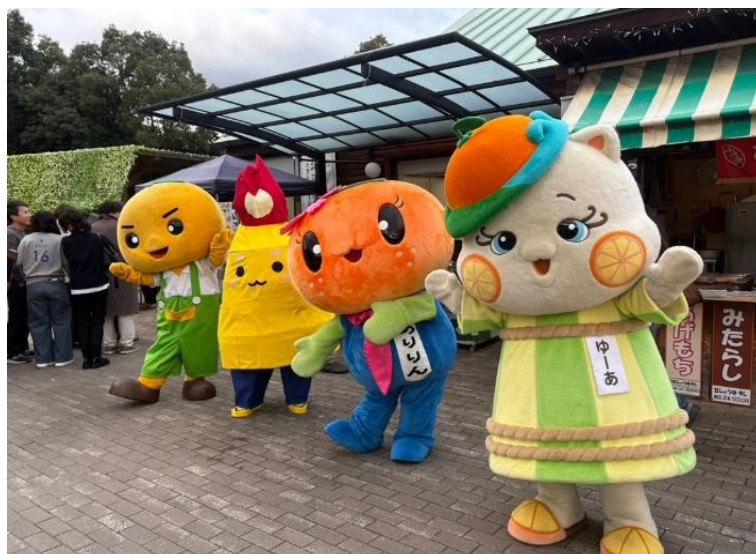
広域連携による観光 PR