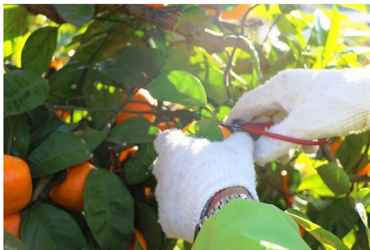
収穫されるみかん

○林業については、山田山等において、森林資源を維持・保全するとともに紀州材の多面的な活用を推進する必要があります。