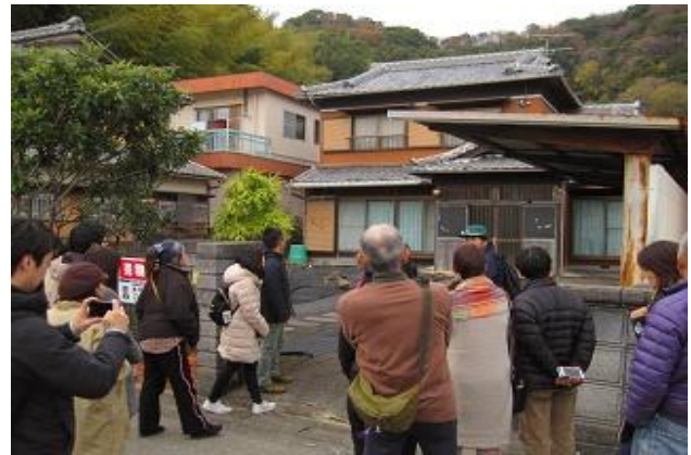
住まい探しの現地案内