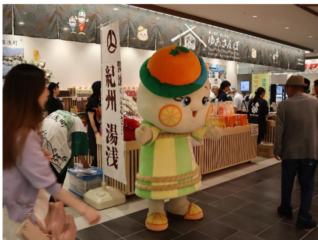
町外での PR イベント