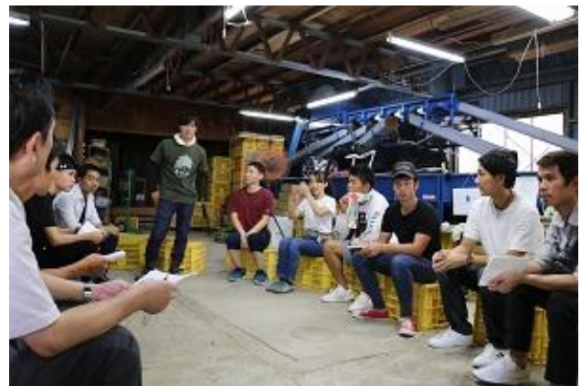
農業体験（大学生フィールドワーク）

○移住・定住に関しては、住まいの確保や、子育て支援やビジネス環境の充実等も重要であることから、他分野の施策と連携・連動して移住・定住に向けた様々な施策を講じる必要があります。