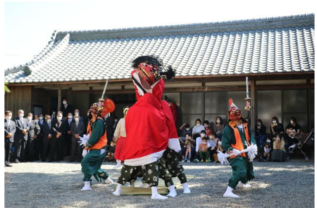
國津神社での三面獅子

○本町では、47の行政区を中心に地域コミュニティを構成していますが、少子高齢化や核家族化が進み、価値観が多様化する中で連帯感が徐々に希薄化し、地域が本来もっている相互扶助の機能が低下しつつあるため、様々な取組により地域コミュニティを活性化していく必要があります。