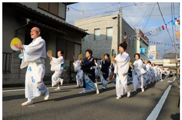
まつりによる町民交流