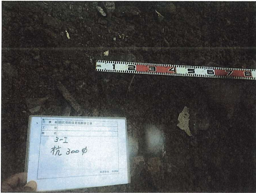
建物解体撤去工事 基礎解体 杭存置 3-I