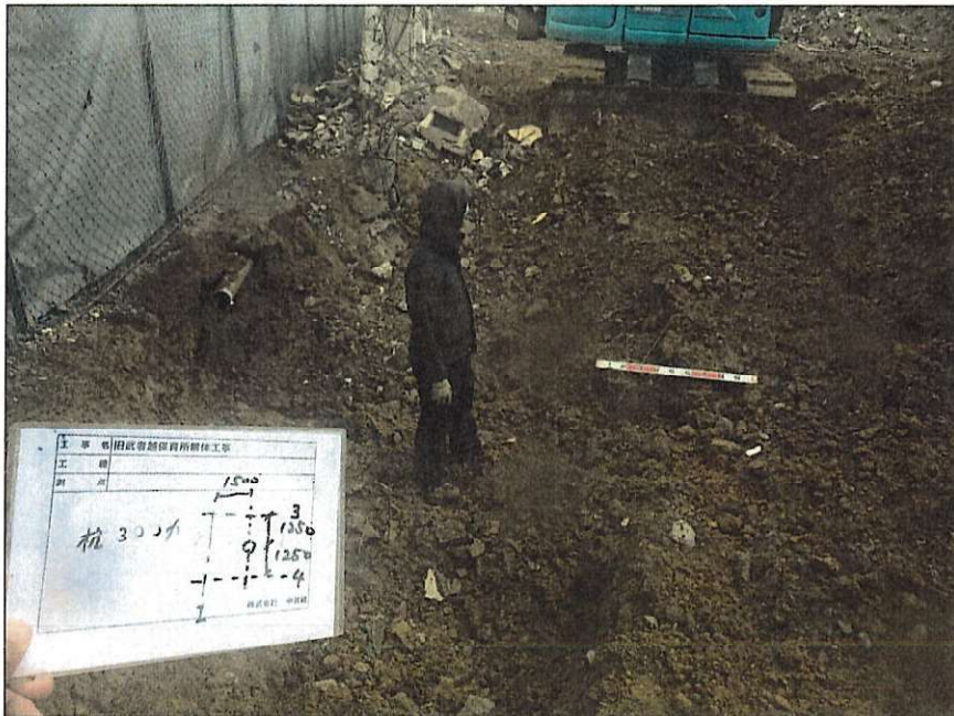
建物解体撤去工事 基礎解体 杭存置 3~4-G~I