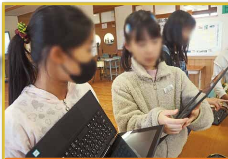
4年 学年全体で「ごんぎつね」