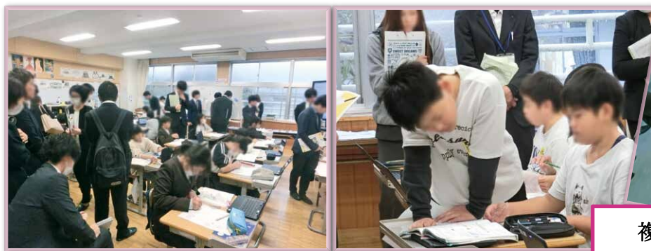
複式授業 自由進度学習