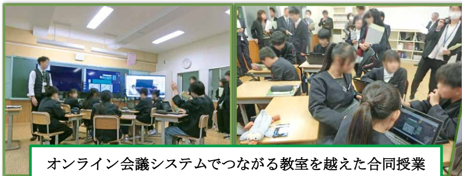
オンライン会議システムでつながる教室を越えた合同授業