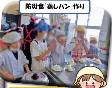
防災食「蒸しパン」作り