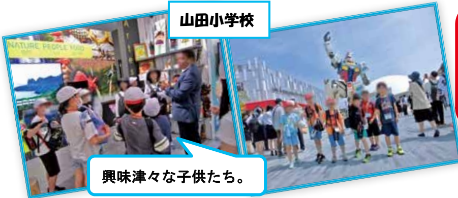
興味津々な子供たち。

楽しそうな笑顔で見学ができたこと、帰校して、バスから降りてすぐに、万博会場での話をしてくれたことが何よりでした。