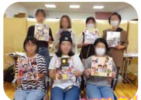
スクラップフッキングを作りました！