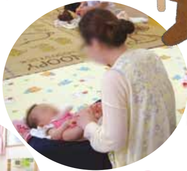
ベビーママ 気持ちいい～！