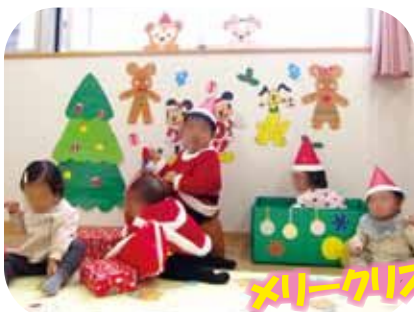
メリークリスマス！