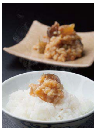
照片左/作為下飯菜、作為下酒菜的美味金山寺豆豉。 右/向大豆、小麥、酒麴裡加入瓜、茄子，用手工精心釀造的美味絕品誕生。