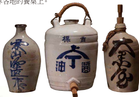
論斤量賣時期的醬油壺

現在小城内只剩下幾家釀造坊，不是像工廠那樣大批量生產醬油，而是耗時1年以上精心釀造、將傳統製造方法一代一代地傳承下來。採用精選的材料、手工精心認真釀造的湯淺醬油澆在生魚片、涼豆腐等的上面，更加襯托出材料的美味。