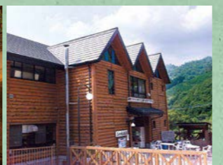
■山田山LOG HOUSE 電話/0737-64-1826 地址/湯淺町山田1638-1