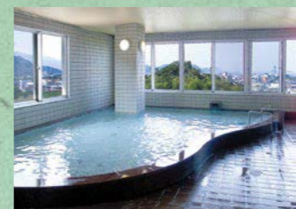
■湯淺城 電話/0737-63-6688 地址/湯淺町青木75

鎌倉時代的武將湯淺宗重將湯淺城址作為據點、宿舍就建造在湯淺城址旁邊，守護著白牆的天守閣，城堡保持原樣。穿行中庭院子的迴廊、遙望著湯淺小城、紀伊水道的風景等也使人倍感爽快。浴池中是湯淺溫泉水、是對慢性皮膚病及肌肉痛等具有療效的單純硫磺溫泉。還有桑拿及按摩浴、當天來只洗浴也可利用。