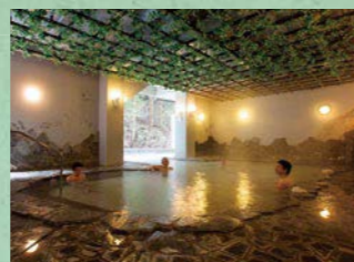
■二之丸溫泉 電話/0737-64-1826 地址/湯淺町山田1638-1

綠色環繞的山巒之中有二之丸溫泉，館內有可供50人洗浴的寬闊露天溫泉、絲柏木的室內浴池，對肩周炎、神經痛等具有療效的溫泉可讓您心滿意足。大門入口前的礦質汲水場也很受歡迎。另外從二之丸溫泉稍稍往山上登行，就是山田山LOG HOUSE。其環繞在四面森林之中，山內小木屋風格的建築內浴室、廁所和廚房等配備完整如同別墅。與二之丸溫泉一起令人倍感舒心欣慰。