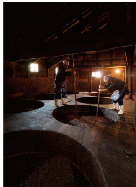
醬油藏人精心釀造