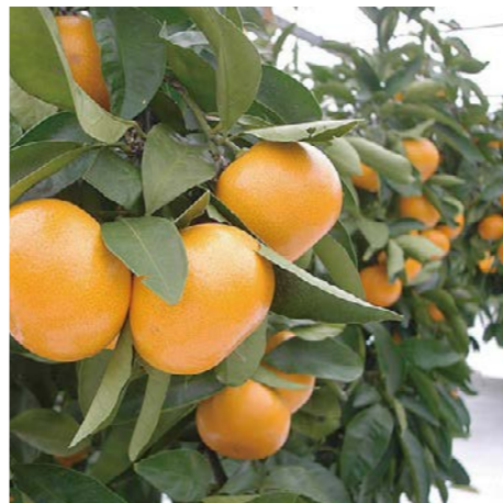
面朝大海、沐浴海風的地理佈局條件培育了散發芳醇氣息的橘子。

湯淺町處在溫暖的氣候與撒滿明媚陽光的大自然懷抱中，因其緊鄰大海、海風不斷將礦質成為吹送過來。