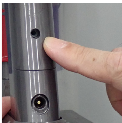
③ビス留めは行わない