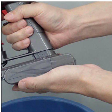
②バッテリーを掃除機に装着