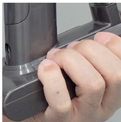
④手のひらをバッテリー底面、指をバッテリー上面にあてがう