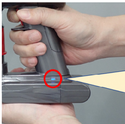
⑤バケツの上で、電池切れになるまで掃除機を運転

運転中、パイロットランプは「点灯」します。電池切れになると、パイロットランプが「点滅」状態になります。