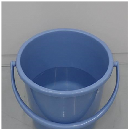
①水を張ったバケツを準備