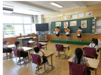
本校1年生「はなのみち」

発表を聞いた友達や先生から、感想と上手にできたところを発表してもらいました。複式学級なので、1年生が2年生の発表をお手本として聞くことができます。上学年は下学年のお手本となるように、下学年は上学年を目標に頑張っています。