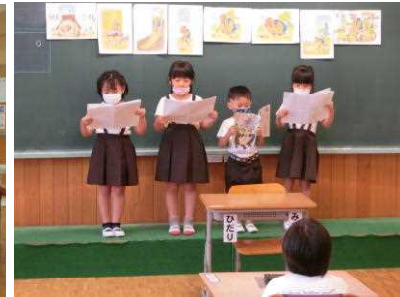
分校1年生「おむすびころりん」