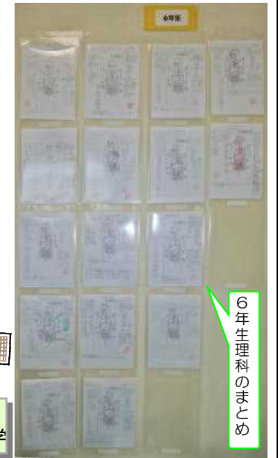
6年生理科のまとめ