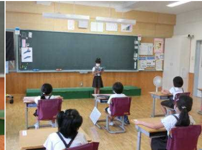
本校2年生「スイミー」