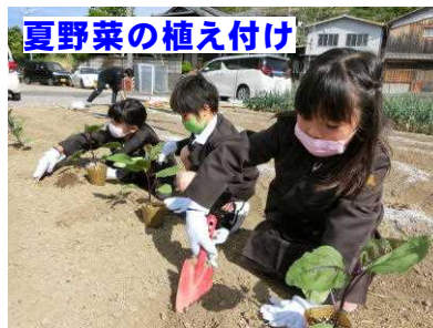
夏野菜の植え付け

そして、5月25日に、昨年10月末に植えたタマネギを学年ごとに収穫して持って帰りました。子供たちが登校しない間も、畑の野菜の手入れや、理科の授業で扱う植物や生き物など、それぞれの時季に応じて準備をしています。畑応援隊の皆さん、今年もよろしくお願いいたします。