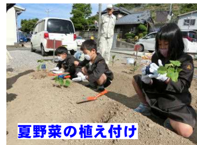
夏野菜の植え付け