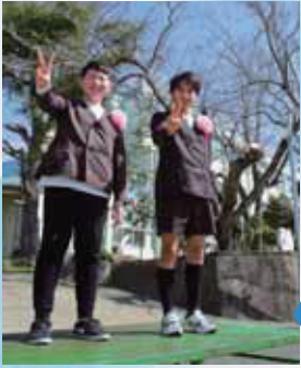
田 栖 川 小 学 校