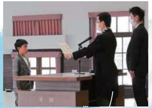
令和3年度 卒業式 フォトレポート