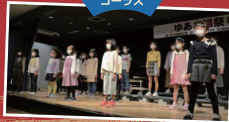
ジュニア コーラス