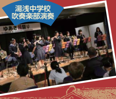
湯浅中学校 吹奏楽部演奏