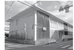
●ふるさと振興課 ●商工観光係 ●ふるさと納税推進係

担当窓口の変更などにより、一部ご不便をおかけすることもあるかと思いますが、ご理解ご協力のほどよろしくお願ひします。