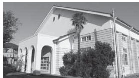
▲登録有形文化財 湯浅小学校講堂

私たちの町にも素晴らしい文化財がたくさんあります。町民の財産である文化財を地域のみなさんと火災から守りましょう。