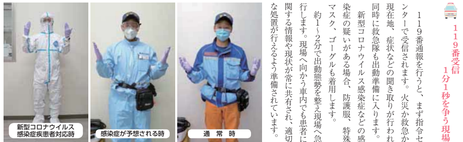
119番受付 1分1秒を争う現場

救急車の車内には、子どもから大人まで様々な事態に対応できるよう、設備や応急処置器具が備えられています。車内は常に消毒を行い清潔に保たれており、救急バッグの中身も定期的に確認し、不足がないよう適宜補充を行い出動に備えられています。