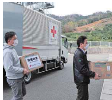
▲日本赤十字社から届いたマスクを運ぶ様子

マスク、アルコール等の感染症対策物資が、全国的に不足するなか、県や企業、個人の方など、各方面より提供を受けました。届いた物資は、感染リスクを考慮し、順次配付を行っています。ご厚意により物資を提供いただいた方々に深く感謝します。