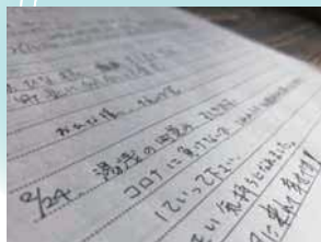
▲北町ふれあいギャラリーにあるノートに書かれていた応援メッセージ