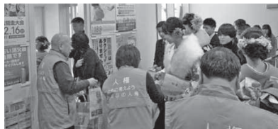
令和元年度成人式において、人権啓発を行いました。