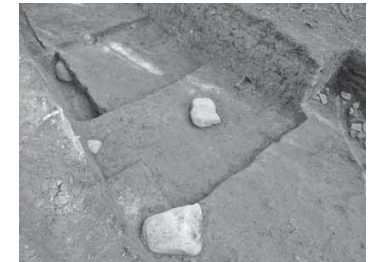
発掘された建物の痕跡(礎石)