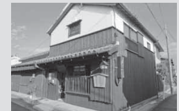
②北町ふれあいギャラリー