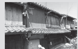
③甚風呂借家棟 (工事中)