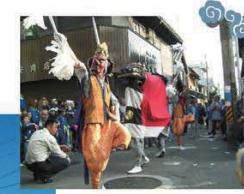
◀ 顯國神社の三面獅子