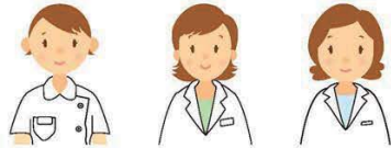
主任ケアマネージャー 保健師 社会福祉士