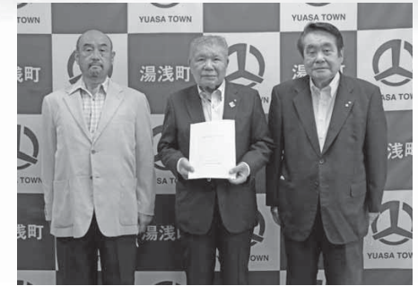
(左から)岡本副会長、上山町長、北村会長

湯浅町水道事業は、人口減少に伴う料金収入の減少や施設の老朽化、耐震化対策など様々な課題を抱えており、現在の水道料金では、今後の施設・管路の更新費用を賄うことができない状況となっております。そのような状況の下、湯浅町では、令和3年度に学識経験者や一般使用者等で構成する「湯浅町水道料金等審議会」を立ち上げ、令和3年11月から令和4年8月まで4回の会議を開催し、水道料金のあり方について検討していただきました。その検討結果をまとめた答申書が、8月30日(水)、審議会会長から町長へ提出されました。