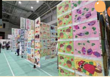
▲素敵な作品が並ぶ作品展示の部