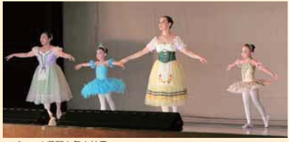
▲バレエの華麗な舞を披露