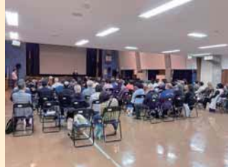
▲人権啓発映画「破戒」上映会