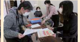
▲マイナンバーカード出張申請窓口を開設