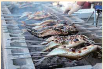
▲ずらりと並んだ焼きサバは圧巻