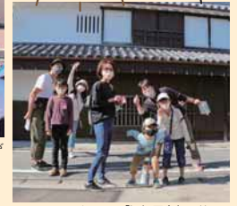
▲チェックポイント「旧栖原家」の前で