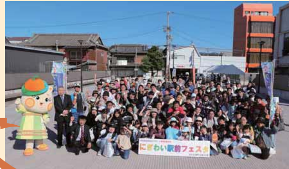
▲初開催のフォトゲイキング大会