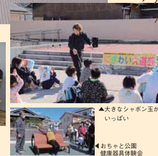
▲大きなシャボン玉がいっぱい