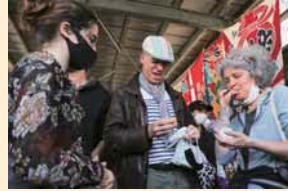
▲アジくんサバくんも登場！▶