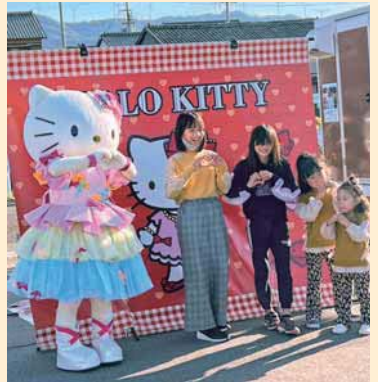
▲ハローキティと写真撮影会