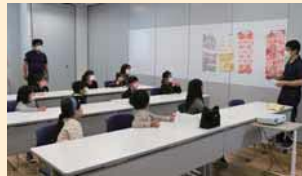
▲啓林館による「わくわく実験教室」