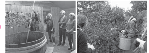
▲醤油造り体験の様子 ▲みかん狩り体験の様子