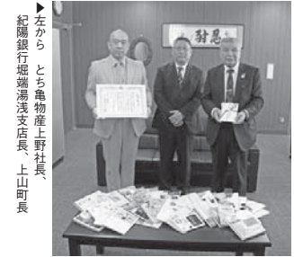
▶左から とち亀物産上野社長、紀陽銀行姫湯浅支店長、上山町長

11月16日に株式会社とち亀物産から醤油醸造に関するストーリーが日本遺産認定を受けた本町に対して、醤油に関連する本32冊を寄贈いただきました。 これは、株式会社とち亀物産が、株式会社紀陽銀行の「紀陽CSR私募債」制度を活用したものです。今回、寄贈いただいた醤油に関する本等を活用し、情報発信につなげるとともに、醤油発祥の地として相応しいまちづくりに取り組んでまいります。