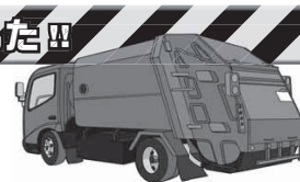
発火原因となったライター▶