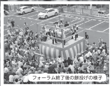
フォーラム終了後の餅投げの様子