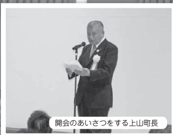
開会のあいさつをする上山町長