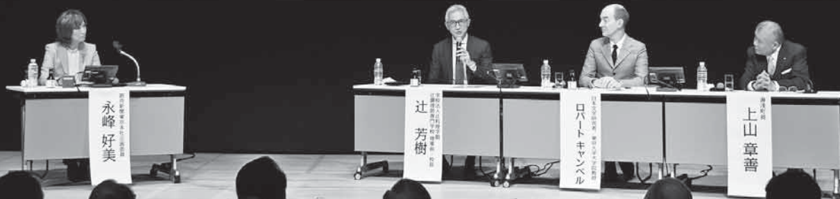
写真 醤油醸造文化の発信による地域活性化を推進するためのシンポジウム 平成28年12月20日 東京都 よみうり大手町ホール