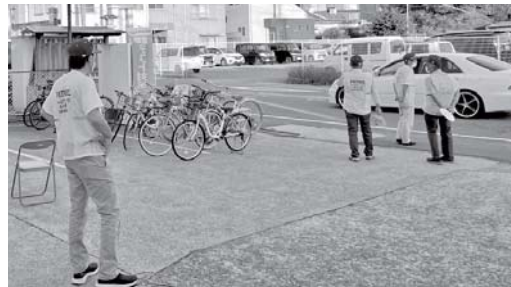
顯國神社宮内警備

また、防犯カメラは町内各所に設置していますので、事件以外の行方不明者捜索や交通事故の際も、警察からの依頼で映像提供することで早期解決につながっています。 ※街頭犯罪：自転車盗難や車上荒らし、器物破損など