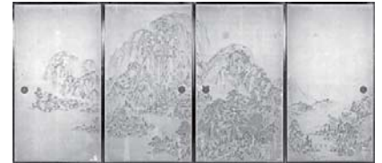
山水図襖(福蔵寺蔵)