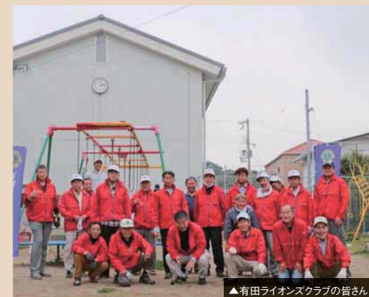
▲有田ライオンズクラブの皆さん