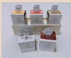
しらすの オリーブオイル漬 株式会社前福