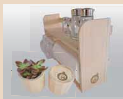
紀州材を使用した ・キッチンペーパー ホルダー ・ウッドポッド 有限会社船山木工