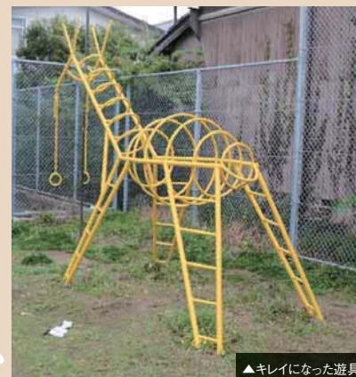
▲キレイになった遊具

4月19日㊤、有田ライオンズクラブのボランティア活動として、田栖川小学校の遊具(ブランコ・鉄棒など)のペンキ塗りを行いました。子どもたちへの思いを込めた作業で、色鮮やかな美しい遊具になりました。