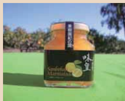
あじおう 味皇 (三宝柑マーマレード) 果樹園紀の国株式会社

令和4年度「湯浅町特産品等開発奨励補助金」で採択された特産品が完成しました。 今後、湯浅町の看板商品として定着し、湯浅町の魅力を町内外へ発信してくれることを期待しています。