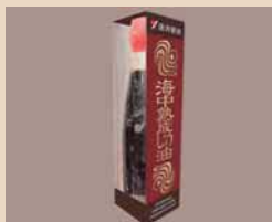
海中熟成しょう油 湯浅醤油有限会社