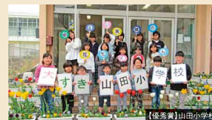
【優秀賞】山田小学校

今年は、県内110校の小学校から応募があり、審査の結果、山田小学校が優秀賞を受賞しました!