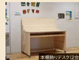
本棚飾りデスク(2台)