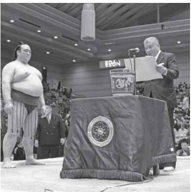
過去の湯浅町長賞授与の様子

■寄附金額 法人 3万円/口 個人 1万円/口 ■募集締切 令和6年2月29日④