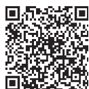
湯浅町ホームページ

申告書が届かない人は、申告書一式をお送りしますので、税務係までご連絡ください。 また、法令等で定める特例の認可を受けている場合は、申告書と併せてその旨を証明する書類を添付して申告してください。