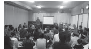
町民人権学習会の風景

「ゆあさ愛・あいまつり」の人権啓発講演会には、多くみなさまにご来場いただきありがとうございました。