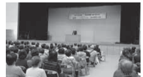
11月1日ゆあさ愛・あいまつり