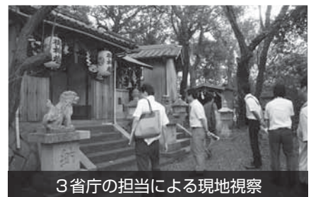
3省庁の担当による現地視察