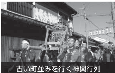
古い町並みを行く神輿行列

地域における歴史的風致の維持及び向上に関する法律（通称：歴史まちづくり法）第1条において、「地域におけるその固有の伝統を反映した人々の活動とその活動が行われる歴史的価値の高い建造物及びその周辺の市街地とが一体となって形成してきた良好な市街地の環境」と定義されています。つまり、建築物や工作物などの建造物と、そこで50年以上前から続けられている信仰、祭礼、伝統行事、産業などの人々の活動が受け継がれている歴史的な市街地の環境のことです。湯浅町では、熊野古道の往来や、伝建地区に代表される醤油・金山寺味噌の醸造、地域の神社のお祭り、古くから営まれている漁業、広川のシロウオ漁、石積みの段々畑でのみかん栽培などが歴史的風致といえます。