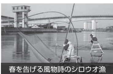
春を告げる風物詩のシロウオ漁

現在、湯浅の歴史的風致を活かしたまちづくりを進めるためにこの計画を作り、国土交通省、文部科学省（文化庁）、農林水産省の3省から認定を受け、湯浅の魅力を高める事業に取り組もうとしています。年内にパブリックコメントを実施する予定ですので、ご意見をお待ちしています。