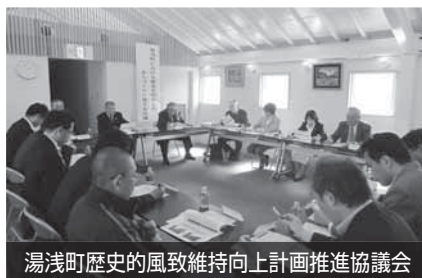
湯浅町歴史的風致維持向上計画推進協議会

現在、湯浅の歴史的風致を活かしたまちづくりを進めるためにこの計画を作り、国土交通省、文部科学省（文化庁）、農林水産省の3省から認定を受け、湯浅の魅力を高める事業に取り組もうとしています。年内にパブリックコメントを実施する予定ですので、ご意見をお待ちしています。