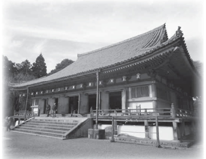
湯浅から運ばれた醍醐寺の金堂