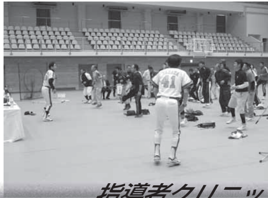
指導者クリニックの様子