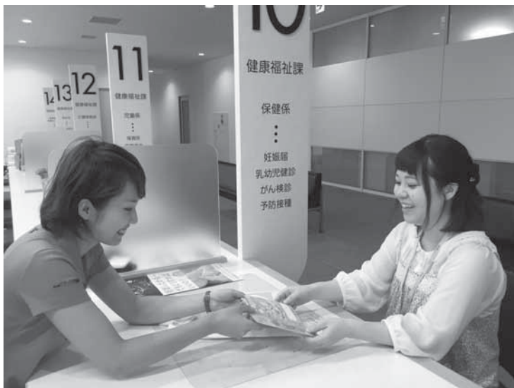
(妊娠届出は受付カウンター⑩です)