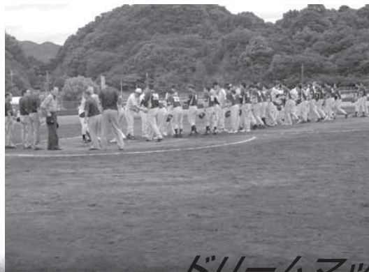
ドリームマッチの様子