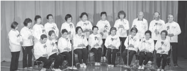
▲総合センターまつり昨年の様子