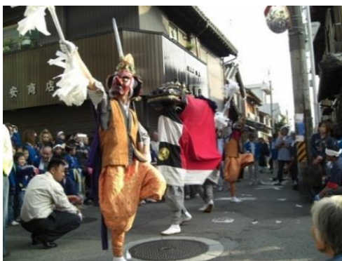
顯國神社の三面獅子