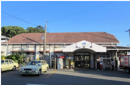
1 9 湯浅駅旧駅舎