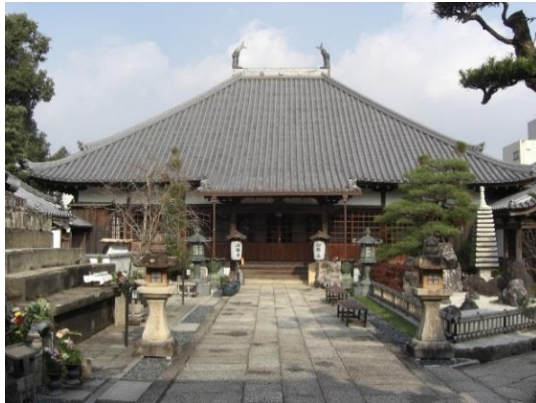
1 8 深専寺