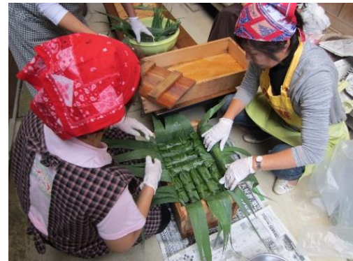
ナレズシ作りの様子