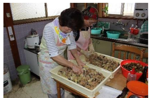
家庭での金山寺味噌作り