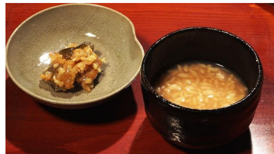
2 2 茶粥