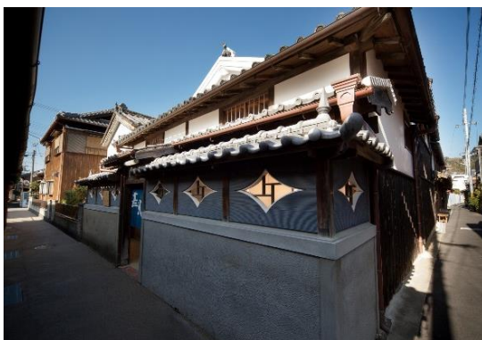
2 0 甚風呂