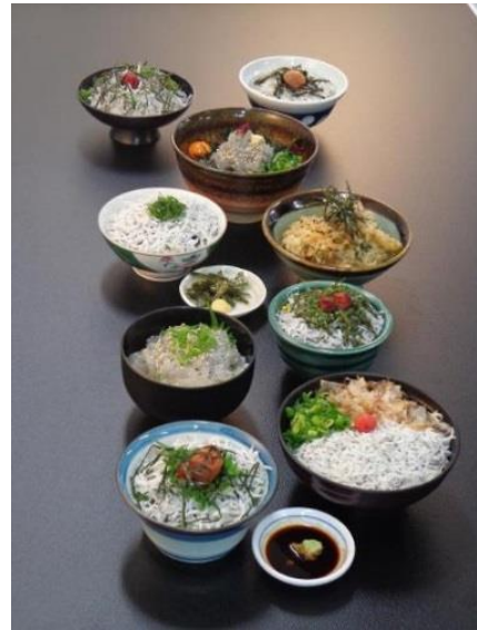
2 1 しらす丼