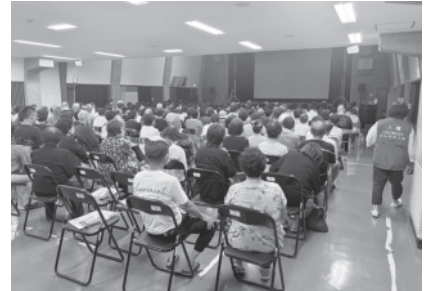
▲人権啓発映画上映会の様子