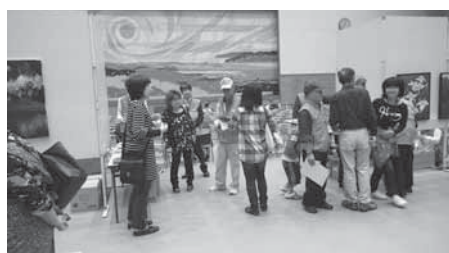
11月2日ゆあさ愛・あいまつり