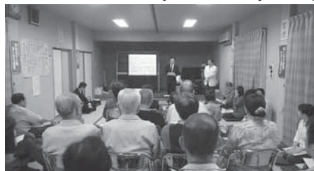
町民人権学習会の風景

「ゆあさ愛・あいまつり」の人権啓発講演会には、多くのみなさまにご来場いただきありがとうございました。