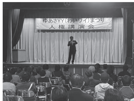
▲人権講演会の様子

今回の講演は、今なお続く部落差別について改めて考える貴重な機会となるとともに、差別をなくしていかなければならないという思いを新たにする場となりました。